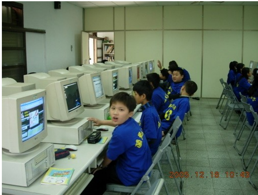
一般國內小學的電腦教室