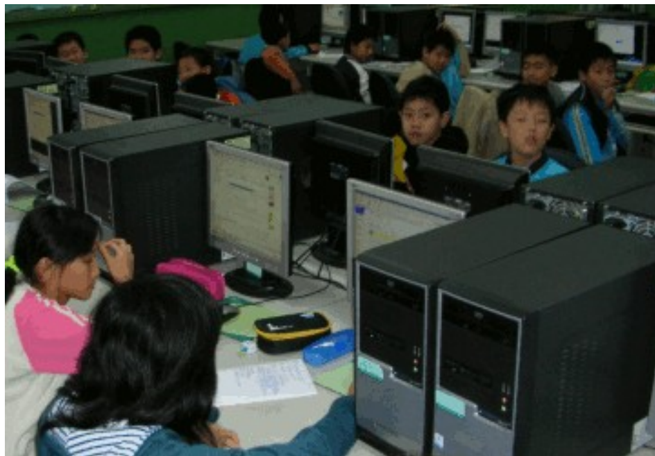
大豐國小電腦教室